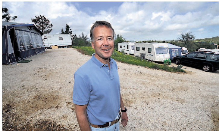
BOBILER: Atte oppstillingsplasser for bobiler og campingvogner rett ved hotellet, sikrer driften vinterstid.