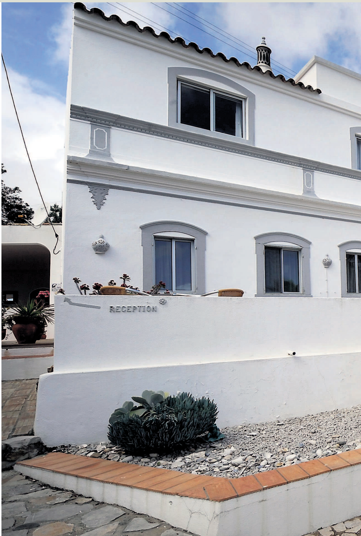
NYMALT: Hotellet er pusset opp og fikk ny maling i vinter. Nå står det der kanskje finere enn noen gang.