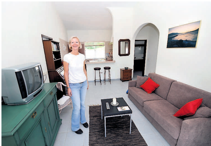
SPESIELT: De seks rommen de leier ut er nyoppusset, men har en gammel stil - og egne kjøkken slik at du kan lage maten selv.