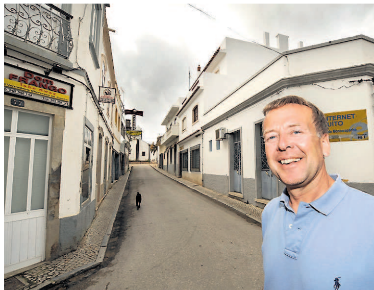
SMALE GATER: Gatene i landsbyen Moncarapacho er smale og koselige.