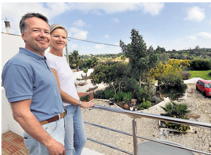
LANDLIG: Hotellet ligger i landlige omgivelser - langt unna det man vanligvis forbinder med et hektisk sydenliv.