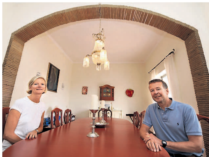
SPISESAL: Casa Rosa har egen spisesal. Om ikke turistene gjør det selv, kan de bestille både frokost og middag hos vertsskapet.