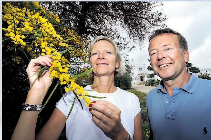
BLOMSTRER: I slutten av mars er blomstringstiden for trær og planter i gang for fullt i sydlige Portugal - også rundt Casa Rosa.